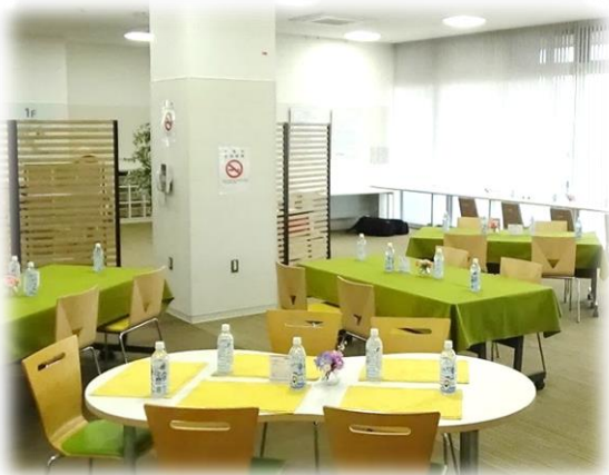
【 健幸レストラン（保健センター1F）会場】