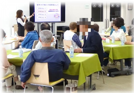
【最初に栄養士より“健康的な食事のとり方”についてお話をします。】