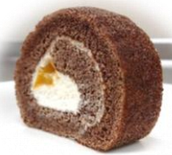
【栄養バランスが整ったおいしいランチを食べます。お食事中にも、健康づくりに役立つお話をしていきます。】