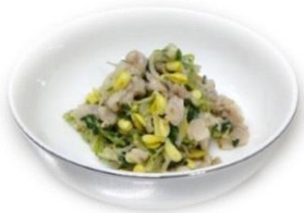
豚肉と豆苗の塩麴炒め